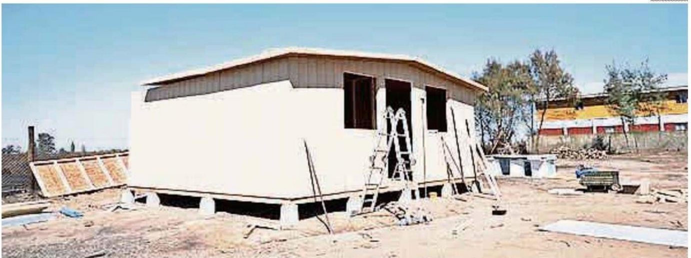
ESTAS VIVIENDAS TIENEN UN CARÁCTER PROVISORIO Y ESTÁN DISEÑADAS PARA CUBRIR DE MANERA INMEDIATA LA NECESIDAD HABITACIONAL.