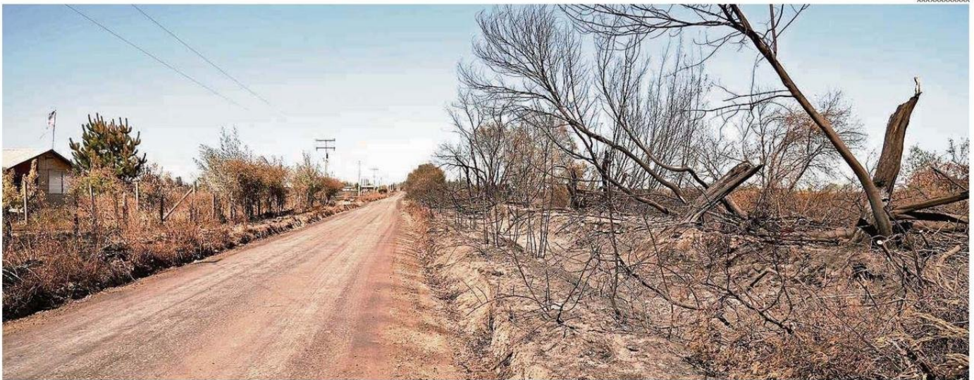
PARTE DEL PAISAJE DE SANTA GISELLE, AFECTADO POR EL INCENDIO FORESTAL DEL PASADO 8 DE FEBRERO.