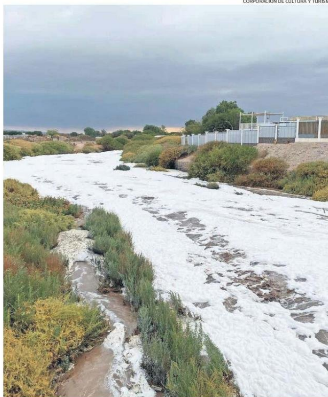
EL RÍO LOA POR SU PASO EN EL PARQUE EL LOA, TRAS EL AUMENTO DE SU CAUDAL. SE RESTRINGIÓ EL ACCESO.

Destacó que la imprudencia de algunas personas que buscan registrar el fenómeno ha llevado a situaciones de peligro innecesario. "Las personas, lamentablemente, con un ánimo de sacar videos, de guardar registro,