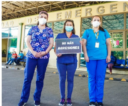
LOS PROPIOS FUNCIONARIOS de la salud han hecho campañas para concientizar por el respeto a su trabajo.

Pese a la disminución de incidentes en las demás áreas del complejo asistencial "Dr. Víctor Ríos Ruiz", las agresiones en el servicio de Emergencias han seguido en aumento desde 2023. "Les pido que también cuiden de nosotros", señaló su director.