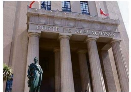
LA CORTE FIJÓ LA FECHA PARA LA MAÑANA DE 17 DE FEBRERO.