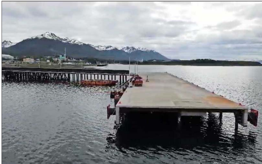
El año pasado, un 55% de las solicitudes de las casi 1.600 concesiones marítimas tramitadas fueron retiradas por los titulares de los proyectos.

de no seguir adelante con su proyecto de inversión.