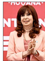
Exmandataria no podría postular por una condena por corrupción, que todavía puede ser recurrida.

LAS CLAVES DEL PROCESO QUE RECIÉN COMIENZA | A 4 EDITORIAL | A 3 COLUMNA DE OPINIÓN | A 2