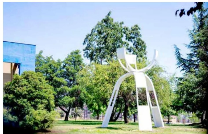
Visitar el Parque de las Esculturas en el Campus Talca es un paseo imperdible, no solo para las familias maulinas, sino para todos aquellos que visitan la región durante las vacaciones.

nuestros Centros de Extensión, tanto de Talca, como de Curicó y Santiago. Así también, dejamos a toda la comunidad invitada a visitar la Galería NUGA de nuestra Casa Central, y por cierto el verdadero museo al aire libre que es nuestro Parque de las Esculturas