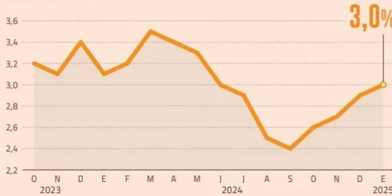
EVOLUCIÓN DE LA INFLACIÓN EN ESTADOS UNIDOS % VARIACIÓN ANUAL

Sin embargo, recordaron que los datos de inflación no han reflejado