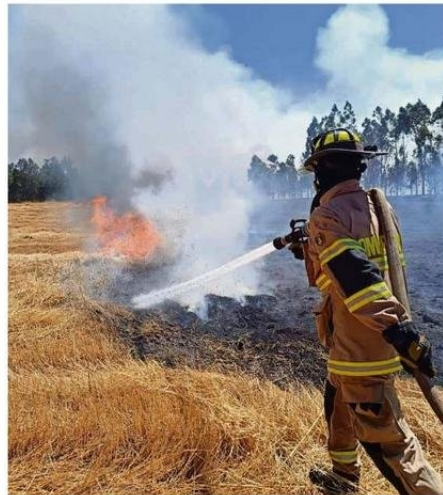
EXTENUANTES HAN SIDO ESTOS DÍAS PARA BOMBEROS DE PAILAHUEQUE.

El Austral pudo confirmar que Bomberos de la Región de Los Ríos salieron anoche en apoyo a La Araucanía, despatchándose seis carros: Lanco, Valdivia, Río Bueno, Paillaco, Máfil y Panguipulli.