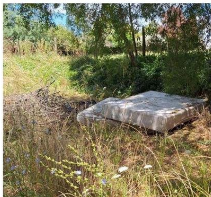
ES FÁCIL ENCONTRAR COLCHONES U OTROS RESIDUOS.