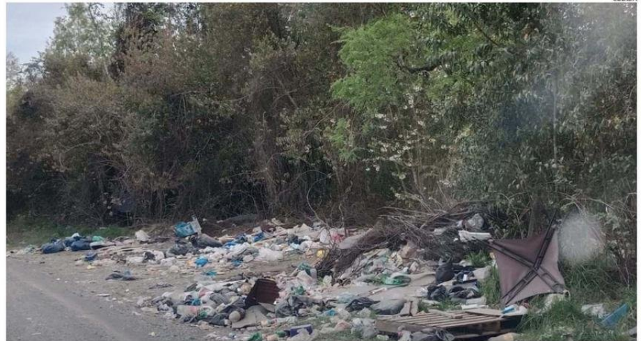
LAS RUTAS DE LA PROVINCIA SE HAN CONVERTIDO EN UN ESPACIO PARA BOTAR BASURA, LO QUE HA GENERADO RECLAMOS DE LOS VECINOS.

Los Pellines, un microbasural se ha formado a escasos metros de un colegio, lo que ha generado serios problemas sanitarios a los residentes.