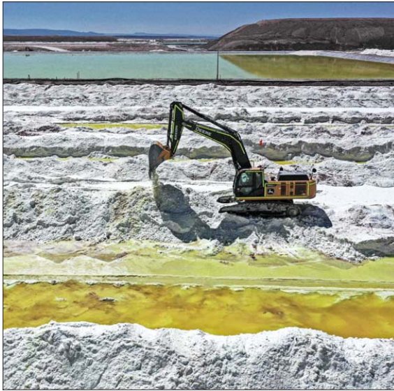
Los cálculos a largo plazo estiman que el precio del mineral se estabilizaría en alrededor de US$ 21.000 por tonelada a partir de 2031.

La expectativa es que el precio promedio de los productos químicos de litio para baterías sea de US$ 10.400 por tonelada este año. Se prevé que la oferta del metal crezca un 23% en 2025, incluyendo las contribuciones del reciclaje, mientras que se espera que la demanda aumente un 18%. En ese sentido, el exceso de oferta mantendrá presionado el precio del litio durante el primer semestre de 2025. Si bien se espera un pe-