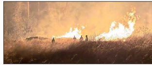
El fuego se aproximaba anoche a zonas pobladas de Collipulli, en La Araucanía. Senapred decretó alerta roja para esa región y el Biobío.

Cauquenes registró 42,2 °C, la máxima de la jornada. A pleno sol, la sensación térmica en algunas zonas se puede acercar a los 50 grados, dice experto.