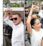
Daniel Noboa y Luisa González se medirían en un balotaje el 13 de abril.

"SE HA CLAUDICADO FRENTE AL 'OCTUBRISMO'" | C 1 CARTAS AL DIRECTOR | A 2