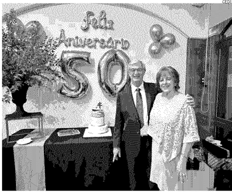
Celebración del aniversario número 50 de matrimonio.