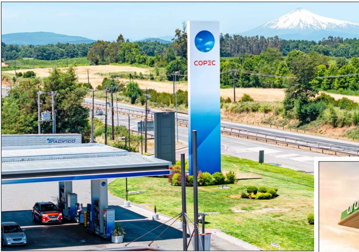
Copec lidera la presencia en la Ruta 5 con 56 estaciones de servicio.