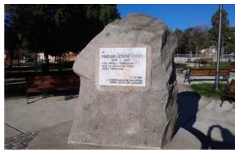
Piedra en recuerdo de la novela Zurzulita de Mariano Latorre, instalada en 1978.