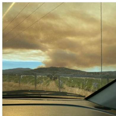
Una imagen casi apocalíptica, en los cerros que bordean Huerta de Maule.