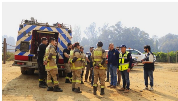
El Alcalde San Javier Jorge Ignacio Silva, personal de Conaf, bomberos y otros personeros, en los angustiosos momentos del incendio.