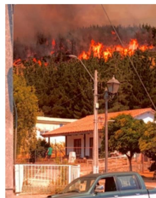
Las llamas amenazan Huerta de Maule: la hora más crítica.

(Nota histórica de Jaime González Colville y aportes del Municipio de San Javier. Se da copia a la Academia Chilena de la Historia)