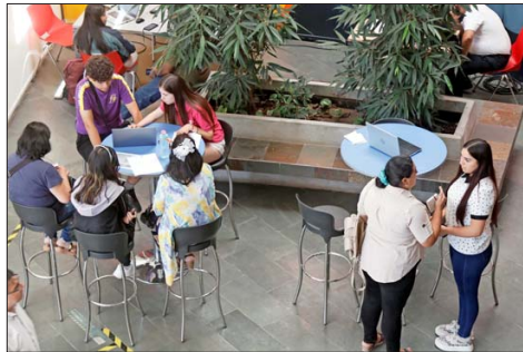
BIENESTAR — Las universidades representan el 55,5% de la matrícula total de la educación superior.

Respecto del ámbito financiero, señala que problemas asociados a beneficios estudiantiles y a distintos tipos de cobros son los más comunes en esta categoría, y agrega que “es importante hacer esfuerzos para que los estudiantes conozcan sus derechos y estén en conocimiento de las herramientas que les ofrece la Su-