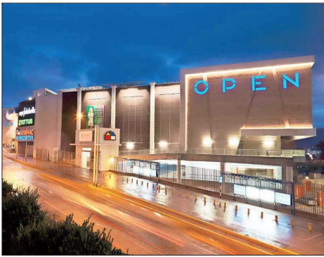
Los centros comerciales del IPSA han estado particularmente movidos en actividad de M&A (fusiones y adquisiciones) en el último tiempo.

A esto se suman expectativas de nuevos recortes de tasas de interés, lo que favorecería a las valorizaciones inmobiliarias de estos activos. “Esta alza depende de los