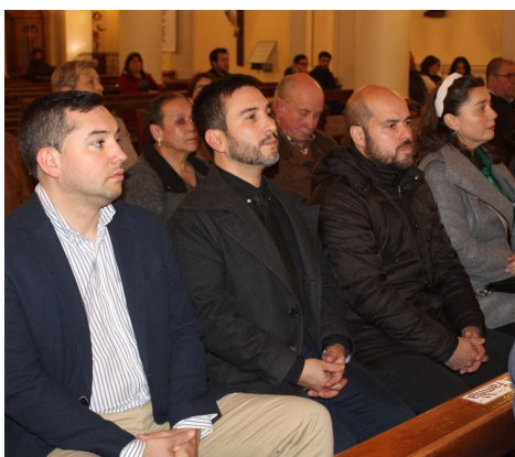
Los timoneles locales de Evópoli participaron solemnemente.