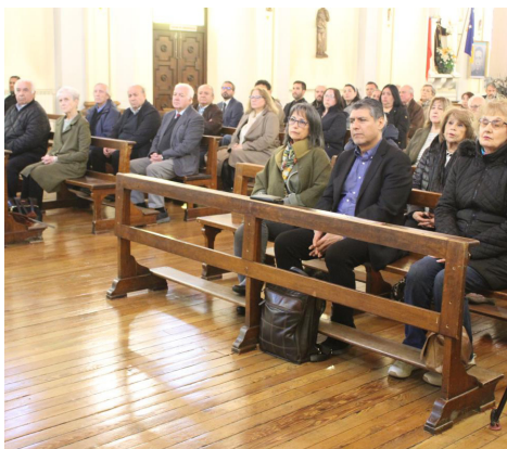
Más de medio centenar de asistentes llegaron a la Catedral.