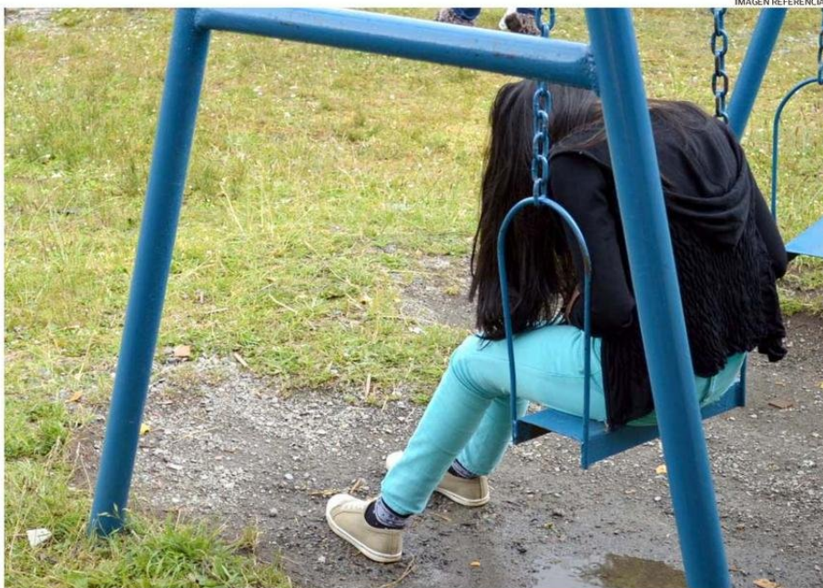
LA SITUACIÓN. DE ACUERDO A PROFESIONALES, ES CRÍTICA Y ESTÁ COLAPSANDO LOS SERVICIOS DE URGENCIA.

es la última atención que recibió en el Cosam una de las pacientes que ha tenido varias descompensaciones.