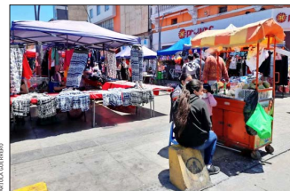
En el comercio (-5,8%) y en otras actividades de servicio (-12,9%) es donde mayormente disminuyó la informalidad el último trimestre de 2024.