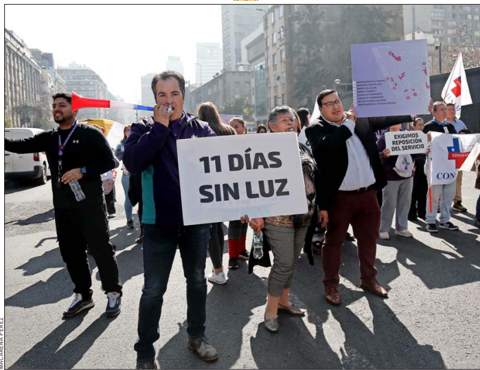
El Proceso Voluntario Colectivo (PVC) se inició luego de los prolongados cortes de luz que hubo en agosto de 2024.

A estas dos bonificaciones se suma una compensación por haber aportado información al Sernac sobre pérdidas de alimentos o de medicamentos. Hay 31 mil familias que recibirán una bonificación extra de $18.000 por ese motivo. En resumen, las compensaciones por los cortes de luz de agosto del año pasado partirán en $2.562 por hogar. El máximo es de alrededor de $406.000, para los casos de las familias que estuvieron más de diez días sin luz, fueron a hacer un reclamo presencial y además hicieron un aporte de información.