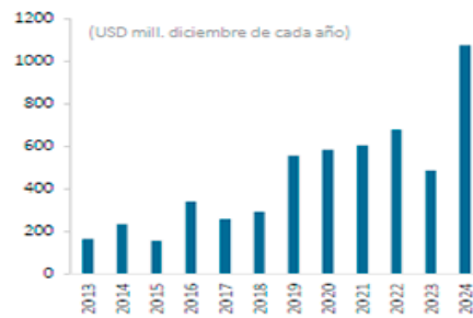
Exportaciones de cerezas en diciembre 2024 alcanzan máximos históricos