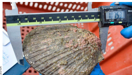
Su extracción termina el 16 de marzo para preservar la especie.

Ximena Gallardo, directora regional de Sernapesca, se refirió al inicio de esta tempe-