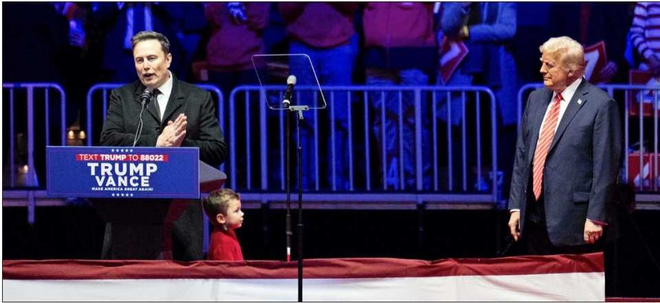
TRUMP DELEGÓ en Musk la tarea de reducir los gastos de las agencias estatales.

Los trabajadores de la agencia recibieron un correo electrónico la noche del domingo instándolos a quedarse en casa y el edificio amaneció custodiado por policías y precintado con una cinta amarilla que impedía el paso. El sitio web de la agencia desapareció el sábado sin explicación.