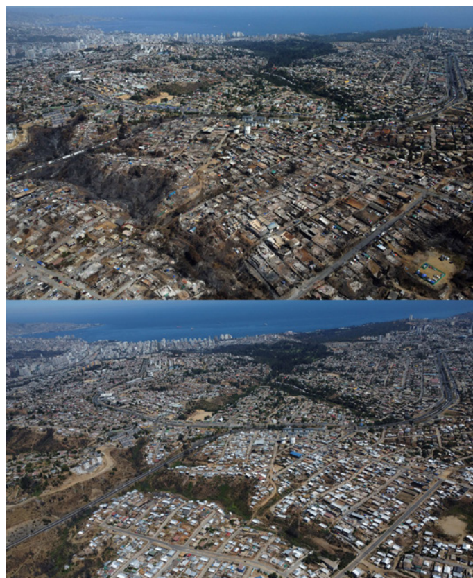
(Imagen comparativa a un año de la tragedia, Villa Independencia)

A eso de las 11 de la mañana se llamó a evacuar el sector de El Salto, en Viña del Mar, se volvió a activar el foco de Peñuelas y también