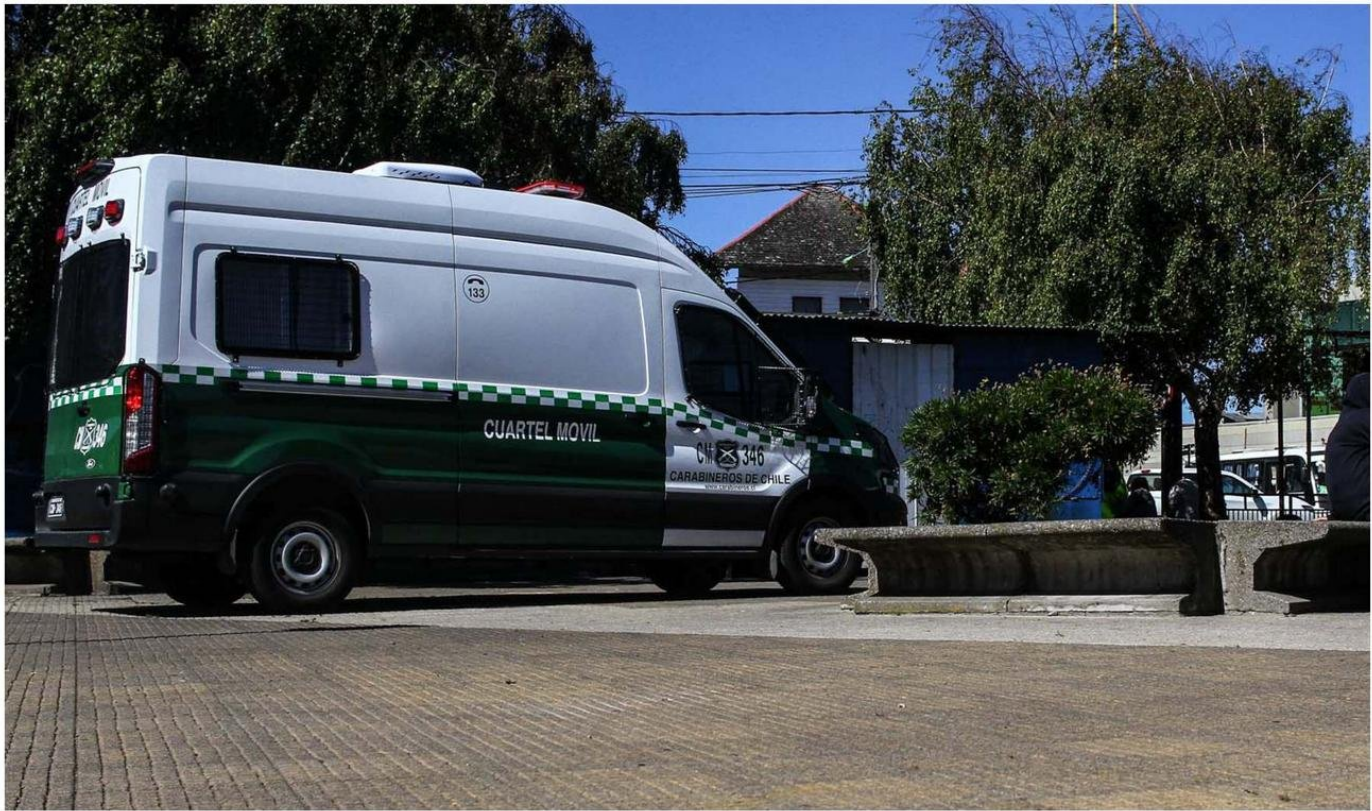
LA ZONA DEL TERMINAL DE BUSES Y LA PLAZA CAMAHUETO SE CONVIRTIÓ EN UN PUNTO CONSTANTE DE HECHOS DELICTIVOS, EN MAYOR PROPORCIÓN EN HORARIO NOCTURNO.