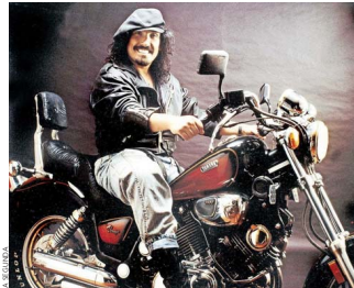
“Si todo el mundo creyera todo lo que se ha dicho de mí, no estaría vivo. La gente cree que uno es carreteero, alcohólico, drogadicto. Y yo soy súper medido”.

clínica y ahí me encontraron el cáncer. Yo le dije al doctor que tenía que volver a actuar esa semana y me dijo: “No te vas a ir para ningún lado. Mijo, negrito, usted tiene una leucemia fulminante.”