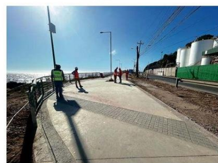
OBRAS SEGUNDA ETAPA PASEO BORDE COSTERO NORTE ENERO 2025

del proyecto Puerto Exterior, abriendo una etapa de precalificación para empresas que puedan asumir este gran desafío de ingeniería. Y hace una semana, suscribimos una Agenda de Trabajo con la Municipalidad de San Antonio, con el objetivo de me-