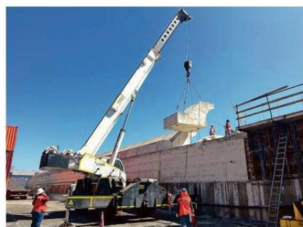
OBRAS EN EL MOLO DE ABRIGO ENERO 2025