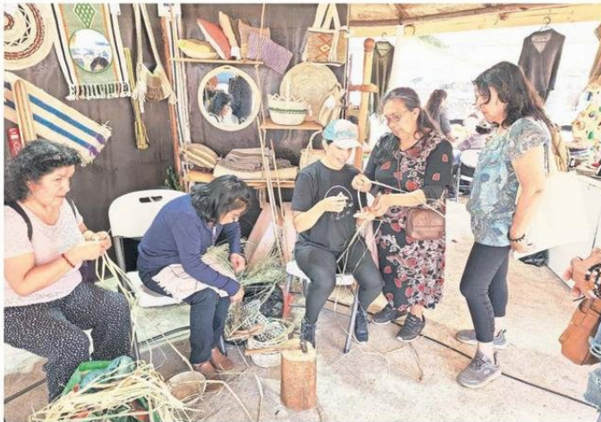
TALLERES QUE DAN A CONOCER EL TRABAJO DE LOS ARTESANOS SE HAN PODIDO REALIZAR EN FAGAF.

La Municipalidad de Cañete organiza la FERIA Agrícola Ganadera y Forestal (Fagaf 2025), que se desarrolla entre el 29 de enero al 2 de febrero, como una forma de dar a conocer las actividades típicas y costumbres del mundo campesino local a través de la demostración y venta de los productos agropecuarios, artesanales y forestales.