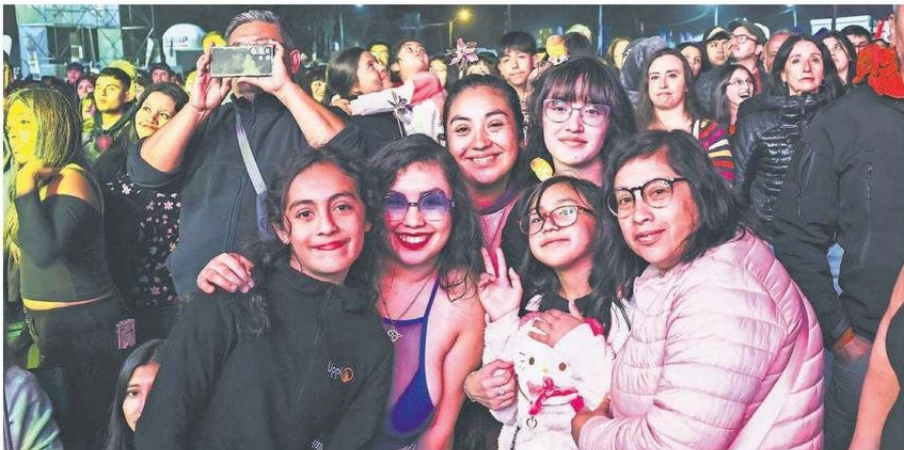
MUCHAS FAMILIAS DE TODA LA REGIÓN DEL BIOBIO Y DE OTRAS ZONAS DEL PAÍS PRESENCIAN LOS SHOWS MUSICALES DE FAGAF 2025.