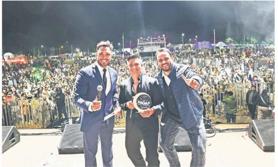
EL CANTANTE NACIONAL AMÉRICO SE PRESENTÓ ANTE UN MASIVO PÚBLICO EN LA EXPLANADA DE LA FERIA. EL PÚBLICO LO ACLAMÓ.