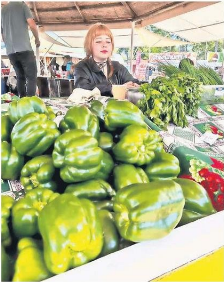
PRODUCTOS AGRÍCOLAS ESTÁN EN VENTA PARA LOS TURISTAS.