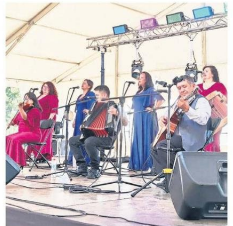
PRESENTACIONES DE MÚSICA FOLCLÓRICA SIEMPRE PRESENTES.