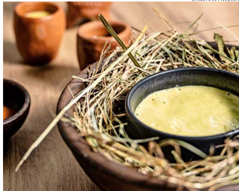
Un plato con el que hace brillar sus raíces chilenas se basa en una reinterpretación de nuestro tradicional pastel de choclo.

Tras estudiar Gastronomía en Valparaíso, decidió salir del país para probar suerte en cocinas internacionales, llegando a trabajar en restaurantes como el “As-trid y Gastón” en Perú, y en otros premiados establecimientos de Canadá, Francia, España o incluso China, donde conoció a su esposa, la sommelier austríaca Judith Lergtperer. En 2022 se radicaron en la tierra de ella, decidiendo montar juntos en Viena su restaurante Z'SOM, que acaba de ser galardonado con una estrella Michelin.