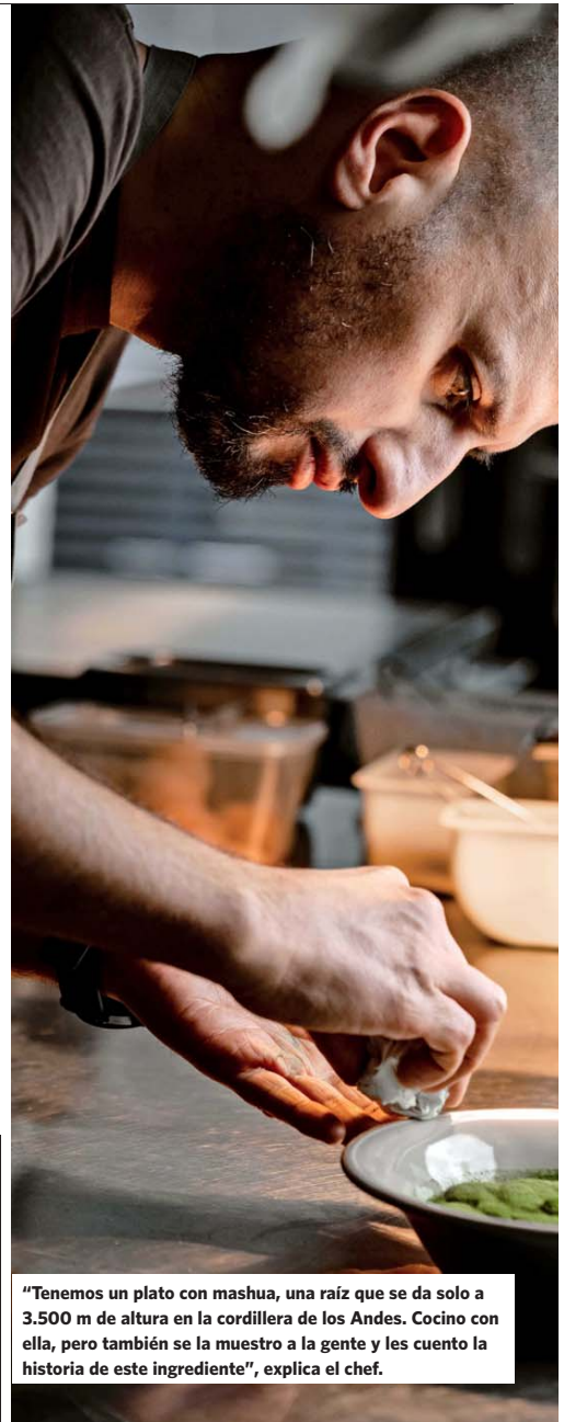
“Tenemos un plato con mashua, una raíz que se da solo a 3.500 m de altura en la cordillera de los Andes. Cocino con ella, pero también se la muestro a la gente y les cuento la historia de este ingrediente”, explica el chef.

—Cuando recién abrimos Z'SOM, intentamos contactar a algún chef local para cocinar “a cuatro manos”, porque necesitábamos hacer ruido. Pero la gente de aquí es muy conservadora. Los euro-