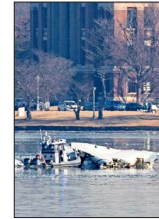
El peor accidente aéreo en dos décadas en EE.UU. deja 67 fallecidos y muchos interrogantes. | A 5

LOS SEIS TEMAS CLAVE DEL DISCURSO DEL PRESIDENTE BORIC PARA EXPLICAR LOS ALCANCES DE LA NORMA | C 2, C 4, C 5 y C 6 JOSÉ PIÑERA: "LARGA VIDA A LA CAPITALIZACIÓN INDIVIDUAL" | B 2 y B 3 CARTAS AL DIRECTOR | A 2