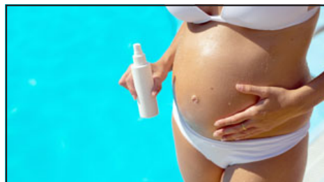
Entregan recomendaciones para que el verano no sea una temporada difícil para las embarazadas. (Imagen referencial).

«Siguiendo estas recomendaciones, pueden disfrutar de esta etapa tan especial mientras protegen su bienestar y el de su bebé. El cuidado empieza con la información, por lo que deben consultar con su médico de confianza ante cualquier inquietud», finalizó.