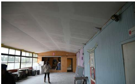
El techo del establecimiento también ha sido renovado.