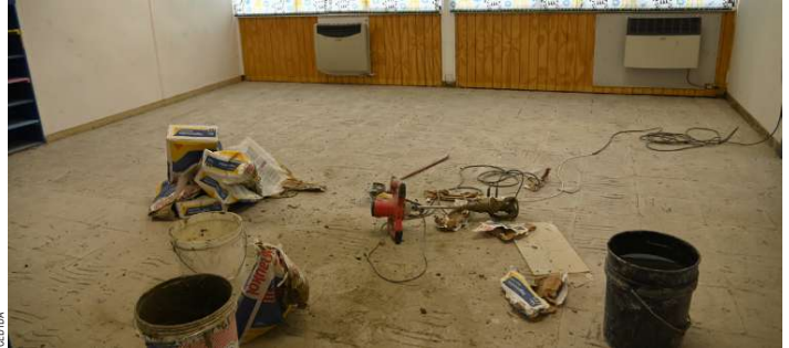
Al interior de las salas de clases ya se puede apreciar el moderno sistema de calefacción central.