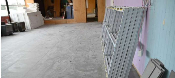
El salón principal de la escuela presenta importantes cambios. Las mejoras continuarán con la instalación de nuevas ventanas.