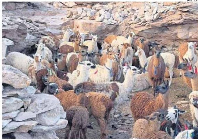
PREOCCUPACIÓN POR FAENAMIENTO IRREGULAR ABRE OPCIÓN DE INSTALAR PLANTA DE FAENA DE BAJA ESCALA

Asimismo, la personera regional, planteó que “son pro-