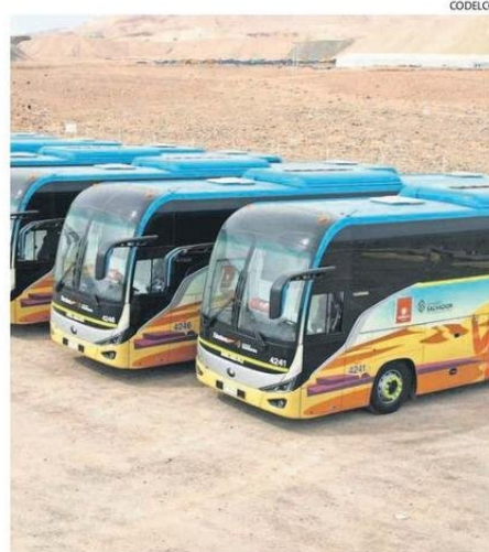
LOS BUSES ELÉCTRICOS SON UNA DE LAS MEDIDAS ADOPTADAS.

biciosa meta, Codelco trazó una estrategia basada en la medición precisa y la colaboración estratégica con sus proveedores. Esto incluye la implementación de herramientas alineadas con estándares globales, como el GHG Protocol, y las categorías del Consejo Internacional en Minería y Metales (ICMM, por sus siglas en inglés), que sean trazables y permitan cuantificar las emisiones a lo largo de toda la cadena de valor, apoyándose en siste-