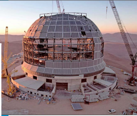
El Smell-O-Scope permitirá en la serie oler planetas lejanos. El telescopio ELT, el más grande del mundo y que se construye en el cerro Armazones (arriba), permitirá, entre otras cosas, saber la composición de las atmósferas de los exoplanetas. Esto no solo permite determinar su olor, sino que saber si puede albergar vida.