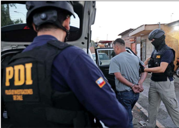
Un operativo coordinado de la fiscalía y policías el 22 de enero permitió la detención de integrantes de Los Piratas de Aragua.

La audiencia en que se formalizan cargos de plagios extorsivos, homicidios y asociación criminal enfrentará una cuarta jornada para comenzar a dilucidar el destino judicial de dos imputados presenciales y tres en ausencia. Los antecedentes del Ministerio Público revelan graves prácticas para cometer ilícitos.