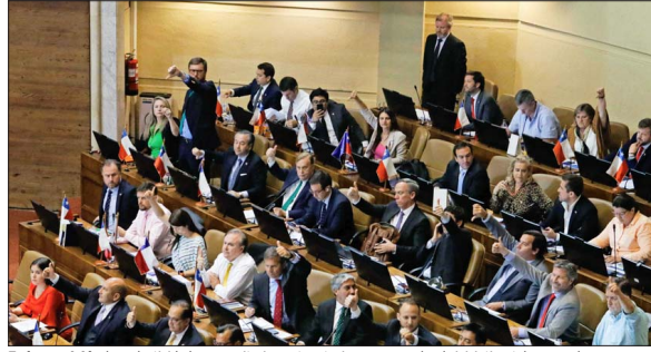
En la oposición, las colectividades mayoritariamente estuvieron por aprobar la iniciativa, tal como se les ve con sus pulgares hacia arriba; mientras republicanos los mostraban hacia abajo, en señal de desaprobación.