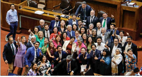
Una vez aprobada la reforma previsional, los ministros presentes se ubicaron al centro del hemiciclo de la sala de la Cámara para inmortalizar el momento con varias selfies y abrazos con representantes del oficialismo.