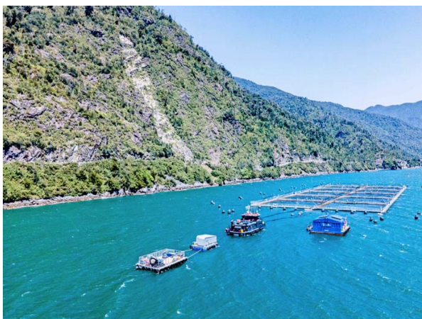
Los servicios de OXZO cubren más del 90% de la industria salmonera local.

Esta compañía es líder a nivel mundial en generación de oxígeno para la industria del salmón, consolidándose como un socio estratégico para más del 90% de la salmonicultura nacional.