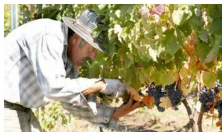
El presidente de Fedefruta, señala que el vino chileno es uno de los mejores del mundo, que el precio que se está pagando por él es muy bajo.

No obstante, destaca que hay buen diálogo con el ministro de Agricultura, Esteban Valenzuela, porque se ha dado cuenta de que el sector debió enfrentar 15 años de sequías y de desastres naturales que los han golpeado fuertemente.