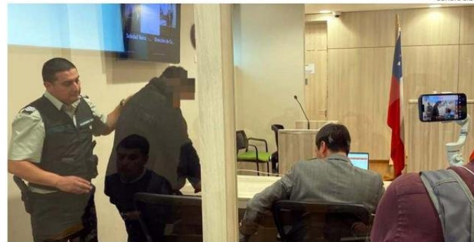
EL JUEVES SERÁ LA FORMALIZACIÓN DEL PATRÓN DE LA EMBARCACIÓN SINIESTRADA.

Tras esta tragedia, existe preocupación sobre la fiscalización y la capacidad de pasajeros que pueden transportar este tipo de embarcaciones.