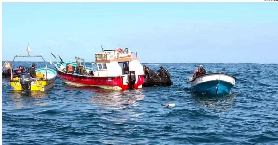
CERCA DE LAS 10 DE LA MAÑANA, SE HIZO EL HALLAZGO DE LA EMBARCACIÓN Y DE LOS TRES CUERPOS RESTANTES QUE FALTABAN POR UBICAR.

víctimas fatales que dejó este naufragio de la lancha "Río Cholguaco", la cual realizaba el recorrido de caleta Córdor a Bahía Mansa.