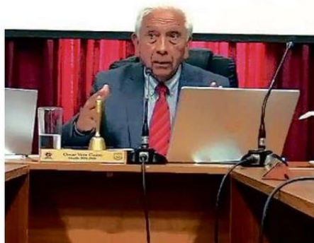
ALCALDE DIO LOS DETALLES CUANDO SE HABLABA DE VEREDAS.

el puente actual o avanzar con el diseño elaborado por el Serviu.