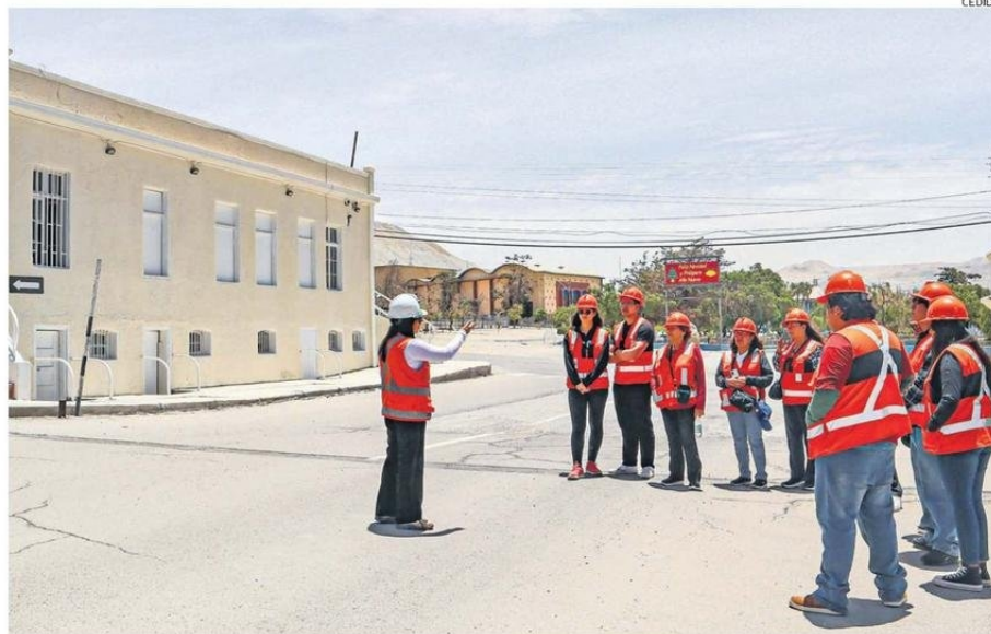
LOS PRIMEROS VISITANTES DEL TOUR A CHUQUICAMATA QUE ABRIÓ SUS PUERTAS EL PASADO 20 DE ENERO. UN PANORAMA PARA ESTE VERANO.

“Todas las personas que quieran venir a Chuquicamata están cordialmente invitadas. Disponemos de buses 100% eléctricos para el traslado, en línea con nuestro compromiso con la sustentabilidad. Estos los llevarán en un recorrido por nuestro histórico campamento, la Pala Mundial y el mirador del rajo, que aún nos sigue entregando su riqueza y que hoy convive con la mina subterránea. Es un tour totalmente gratuito y abierto a la comunidad”, subrayó.