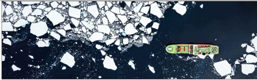
Coordinada por Brasil, la expedición ICCE rodeó la Antártica en el rompehielos ruso "Akademik Tryoshnikov" para recolectar datos glaciológicos, oceanográficos y atmosféricos, así como tomar muestras de masas de hielo costeras. A bordo iban 51 científicos de siete países.