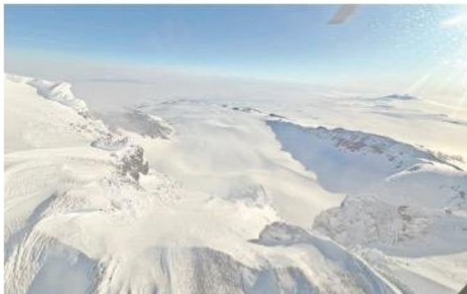
Vista aérea desde uno de los helicópteros.