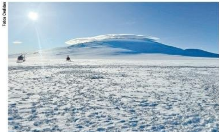
La magnificencia del continente blanco en todo su esplendor.