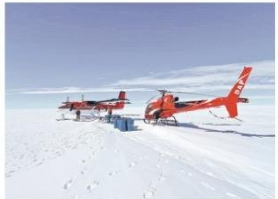
Uno de los helicópteros Dap junto a uno de los aviones que también fueron parte de la expedición.