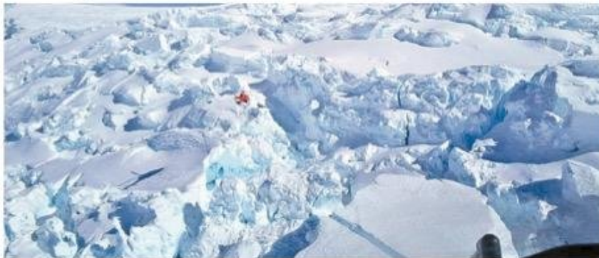
Uno de los helicópteros Dap en su sobrevuelo.