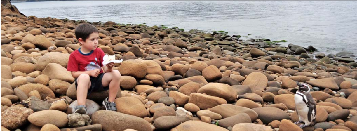
En verano es normal observar crías de pingüinos y de lobos marinos en las costas, pero no se les debe alimentar, molestar, acercarse o intentar hacer selfies . En la foto, un niño y un pingüino se observan mutuamente en una playa de Lacuy, Ancud, Chiloé.

EN UN AÑO SE REPORTARON CINCO CASOS DE PERSONAS MORDIDAS POR LOBOS MARINOS EN EL PAÍS