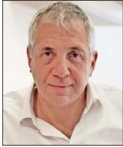
Roberto Alvo, CEO de Latam Airlines.

El estudio tomó los perfiles y publicaciones de los CEO de las 100 empresas líderes del ranking Merco 2024 —que mide la reputación corporativa de las empresas que operan en nuestro país—, revisando más de 1.500 posts en LinkedIn. Para los resultados, midieron el desempeño de cada líder considerando la interacción en la red social a través del estatus del perfil, reacciones, comentarios, comparti-