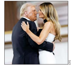
1. La pareja presidencial de Estados Unidos durante el Baile del Comandante en Jefe, enfocado en el servicio militar, el cual se realizó después de la toma de posesión. En ese momento, sonaba "Battle Hymn of the Republic" (con el estribillo Glory, Glory, Halleluya), con Elvis Presley.