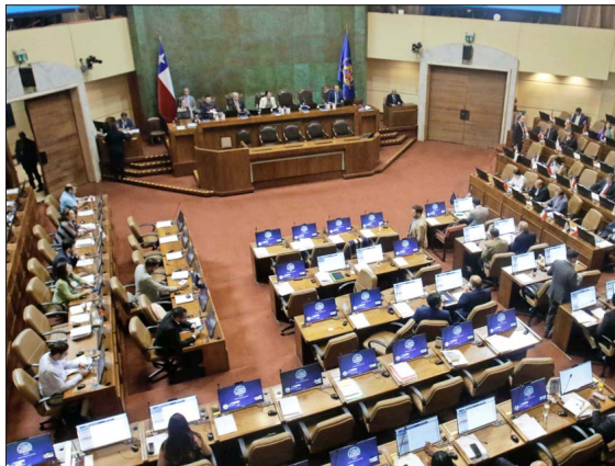
La sala de la Cámara de Diputados debería votar el próximo miércoles la reforma previsual, en tercer trámite. Ahí se conocerá si se va a ley o a comisión mixta. Eso dependerá de si los diputados ratifican o no los cambios del Senado.

Quizá la principal aprensión de los expertos está puesta en el riesgo de no concebir una buena ley, ante el apuro. El frenesí, recuerdan, ya ha pasado la cuenta, tal como sucedió con la denominada ley de cumplimiento tributario, en que los cálculos simplemente no dieron y, por ejemplo, las autoridades a cargo no apuntaron correctamente a la recaudación por repatriación de capitales. De eso advirtió la senadora Ximena Rincón (Demócrata), y en el caso de la previsual, mantiene temores respecto de los cálculos de Hacienda y la Dipres porque, ha afirmado, la información entregada deja más dudas y menos certezas.