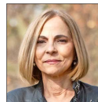
GUIDO GIRARDI EXSENADOR PPD

"La reforma de pensiones va a marcar la vida de millones de chilenos por las próximas décadas, por lo que merece al menos cuatro semanas adicionales para afinar lo que a muchos preocupa. Se están forzando plazos para votar en el Congreso una reforma muy compleja. Una combinación arriesgada para una reforma de su envergadura".