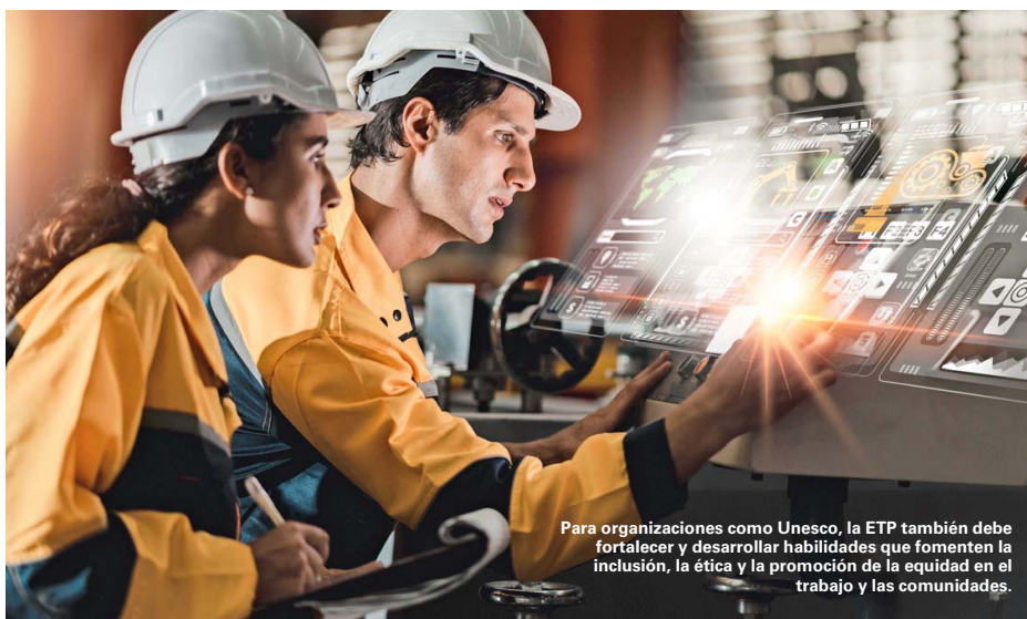
Para organizaciones como Unesco, la ETP también debe fortalecer y desarrollar habilidades que fomenten la inclusión, la ética y la promoción de la equidad en el trabajo y las comunidades.